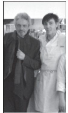
A Londra al termine di una cena con ospite Nicola Piovani, pianista, direttore d'orchestra e compositore di successo (di lui si ricorderà l'Oscar vinto nel 1999 per la colonna sonora del film "La vita è bella" di Benigni)