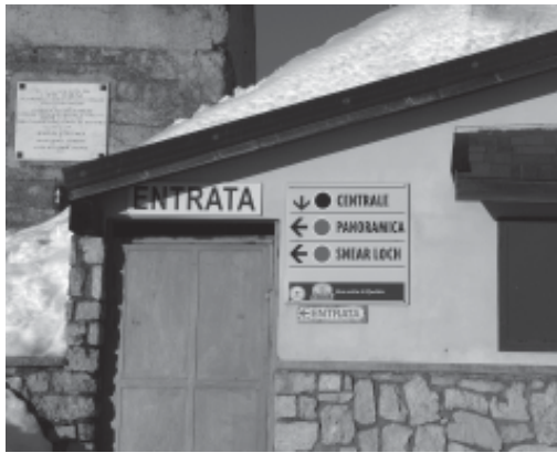
- La centrale per il funzionamento della seggiovia Verenetta - Rifugio Verena, posta a ridosso del forte e della targa che ricorda i 49 artiglieri italiani caduti in combattimento nel 1915

È con grande meraviglia che apprendiamo la presa di posizione dell'Ente regionale preposto alla tutela ambientale di luoghi classificati "di interesse storico-culturale". Il "niet" imposto alla creazione di una pista da cross in località Sasso è indice di sensibilità (si legga a tal proposito articolo su numero scorso del Giornale Altopiano), ma mettendoci nei panni di chi da anni aspettava la realizzazione della nuova struttura sportiva, ci uniamo allo stupore dei bikers nel sentire come il divieto non sia dettato per evitare inquina-