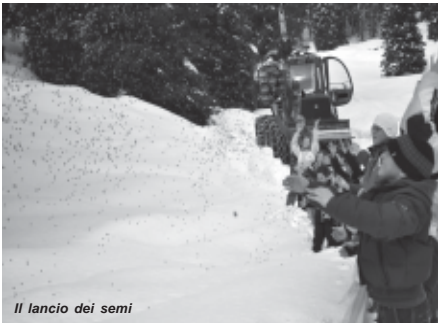
Il lancio dei semi

motoslitta a Valmaron e la filiera del legname fino all'utilizzo dei cascami di lavorazione per la produci energia al biodigestore del Turcio, dalla troupe di Geo e Geo che manderà prossimamente in onda le riprese altopianesi. Gerardo Rigoni