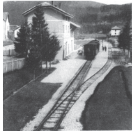
-La stazione del treno Rocchette-Asiago a Cesuna, abbattuta per far spazio ad un parcheggio prospiciente le piste da sci

Che fine hanno fatto le trincee sulle discese del Kaberlaba? Come fu possibile in Comune di Caltrano costruire, parliamo del decennio appena concluso, gli spogliatoi per i fondisti di fronte al Rifugio Pozza del Favero, dove stava un comando del corpo di spedizione britannico, con un cimitero per i caduti inglesi poi traslati al Magnaboschi? Ma non è finita. Appena fuori l'abitato di Cesuna in direzione Canove insisteva un cimitero di guerra dedicato al capitano Antonio Brandi (vedasi Touring Club Italiano, Guida al Veneto - ediz. 1997); prima della fine del secolo scorso era ancora visibile il muricciolo perimetrale, ma anche quel poco che restava è stato spianato per lasciar spazio agli allenamenti degli atleti praticanti il biathlon. Struttura poi abbandonata e lasciata in balia delle sterpaglie. Proseguendo nell'infinita serie di interventi ricordiamo l'abbattimento del casello-stazione con annesso edificio a Cesuna, dove fermava il mitico treno della linea Rocchette-Asiago, per fare