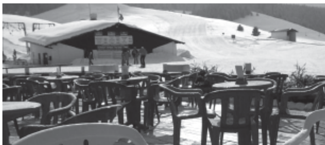
-Valbella: qui si combatté la Battaglia dei Tre Monti, quante trincee sono state eliminate per spianare le discese agli sciatori?

Dal sito www.sbap-vr.beniculturali.it scopriamo che: "La Soprintendenza per i beni architettonici e paesaggistici per le province di Verona, Rovigo e Vicenza, organo periferico del ministero per i beni e le attività culturali, svolge compiti di tutela del patrimonio culturale nel territorio di competenza e coopera con gli altri enti territoriali per la sua valorizzazione". Fin qua tutto bene. Premesso ciò e quanto sopra spiegato sulla pista, è lecito chiedersi: ma dove era la Soprintendenza, che oggi onorevolmente si ostina su una valletta forse impropriamente classificata "trincea", quando nel 1960 si portò avanti il disegno di un campo da golf ad Asiago? Quante trincee francesi e italiane sono state spianate per creare il primo percorso a 9 buche? E quando: "le prime piantagioni nel 1965 e furono messe a dimora, accanto al grande bosco esistente, oltre diecimila piante di abeti, larici e faggi.