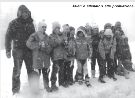
Atleti e allenatori alla premiazione

tormenta di vento e neve che costringe tutti a nascondersi sotto i cappucci e imbacuccarsi in giacche a vento e mantelli, arriva il momento tanto atteso della premiazione: i risultati individuali già si conoscevano e l'attesa era tutta per la classifica di società. Lo speaker annuncia: 5° posto per la Polisportiva Sovramonte, 4° posto per S.C. Bosco, 3° posto per l'U.S.A. Asiago Sci, 2° posto ... Sci Club 2A Asiago Altopiano e scoppia fra i piccoli atleti un urlo, liberatorio prima, e di gioia poi. Tutti sul palco assieme allo squadrone del Valpadola che si è aggiudicato questa edizione. Poi il solito copione che, fortunatamente, si ripete da anni: foto di gruppo con coppe e tormenta, gelato nella gigantesca coppa azzurra e poi ritorno in terra Altopianese, stanchi ma felici. Ultimi scampoli della stagione, ancora qualche uscita, clima permettendo, per soddisfare le richieste di gioiose sciate senza impegno agonistico e, poi, gli sci andranno in soffitta in attesa della prossima stagione, in attesa della 34esima edizione del Latte Busche, in attesa di un nuovo podio.