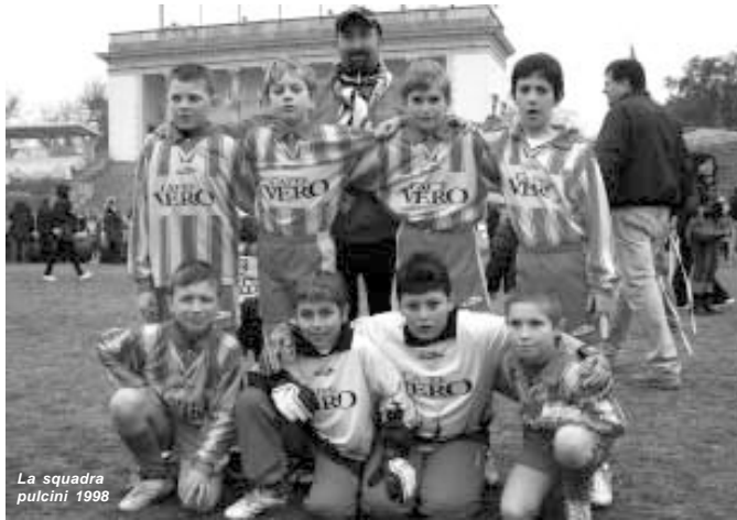
La squadra pulcini 1998

costante, ha un po' rovinato la giornata, ma i nostri pulcini si sono comunque divertiti anche a partecipare, tra una partita e l'altra, ai vari giochi proposti all'Inter Village all'interno di strutture gonfiabili e campetti in erba sintetica. Nella mattinata incursione quasi clandestina del presidente Massimo Moratti, che non è riuscito a scappare senza firmare qualche autografo, e il saluto ai ragazzi di Marco Materazzi.