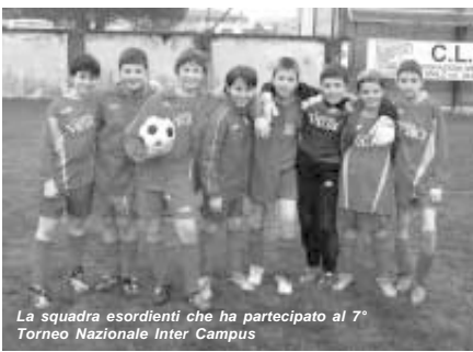
La squadra esordienti che ha partecipato al 7° Torneo Nazionale Inter Campus