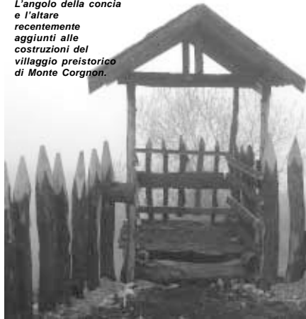
L'angolo della concia e l'altare recentemente aggiunti alle costruzioni del villaggio preistorico di Monte Corgnon.