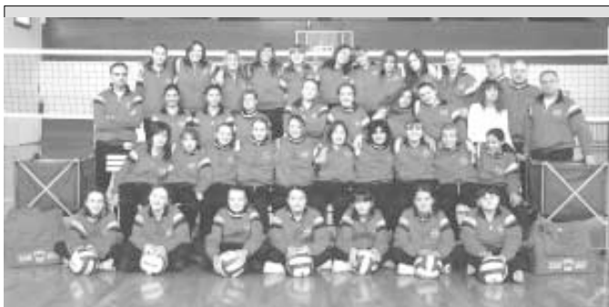
La pallavolo Asiago - stagione 2007/2008 - info: 333 240 4037 - www.slegarvolleyclubasiago.it