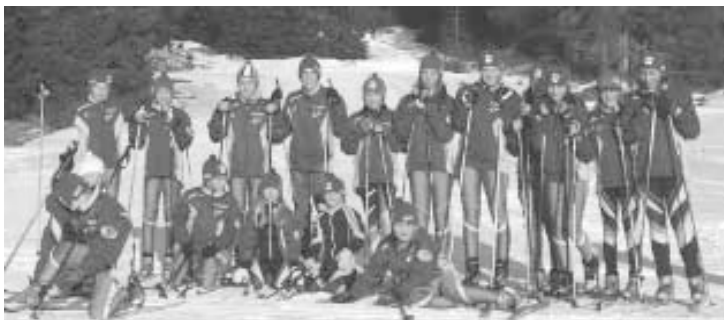
Gruppo sci nordico