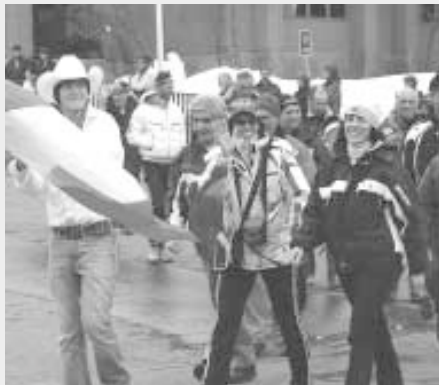
La Squadra italiana sfila il giorno dell'apertura del coppa del Mondo Master di fondo

single a parte, il medagliere italiano è tornato adorno di numerosi riconoscimenti, 9 ori, 7 argenti e tredici bronzi che se rapportati al numero di partecipanti per singola nazione la dicono lunga sui meriti dei nostri master. Prima si è classificata la Russia che ha portato a Ponderosa un totale di 122 concorrenti, 2° gli Stati Uniti d'America con ben 660 iscritti al via, 3° Norvegia e 4° l'Italia (31 atleti). Prossimo appuntamento della World Cup nel 2009 sulle nevi francesi. G. Dalle Fusine