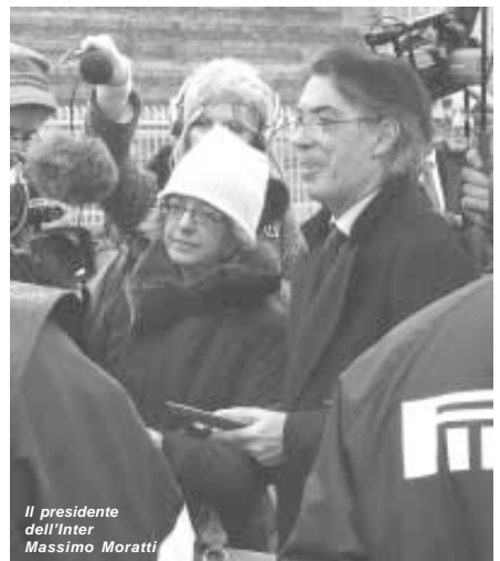
Il presidente dell'Inter Massimo Moratti