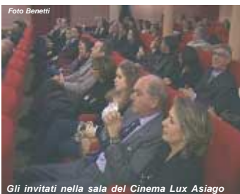
Gli invitati nella sala del Cinema Lux Asiago

viaggio per 4 persone (2 adulti e due bambini) nel villaggio vacanze francese di Clairmontelles, nella regione dell'Ain, dov'è stato girato il film. Grandi e bambini, purché amanti della Natura, siamo tutti invitati a concorrere. S.L.