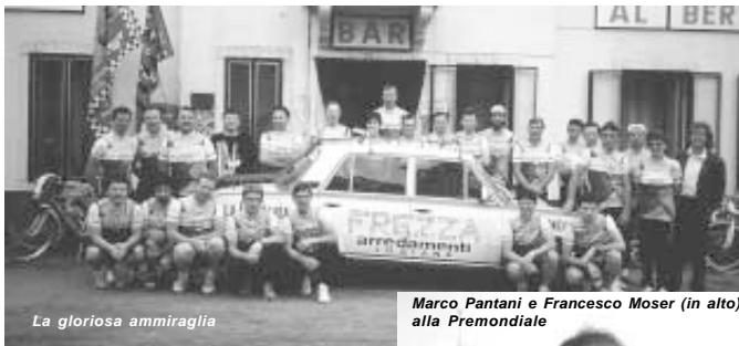
La gloriosa ammiraglia