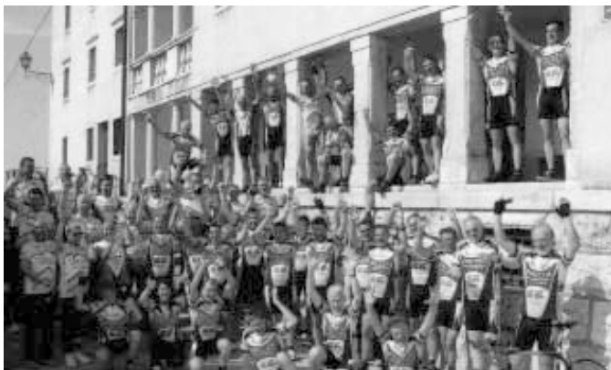
Venticinque annidi Gruppo

Un cambio necessario, che si auspica ormai da qualche tempo e che porterà innovazione e nuovi entusiasmi per l'ottimo proseguito del G.C. Frezza Arr.ti Lusiana.